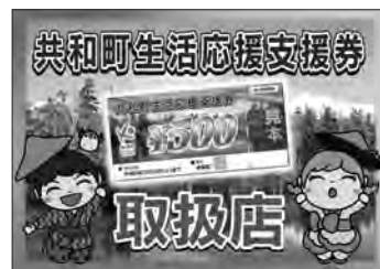
取扱店ステッカー