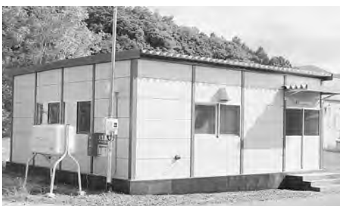
仮設国富地区住民センターの外観

これまで第2投票区の投票所として利用しておりました国富地区住民センターは、建て替えのため現在利用できません。そのため、7月10日執行の第26回参議院議員通常選挙に係る第2投票区の投票所は仮設国富地区住民センターに変更となりますので、お間違いのないようお願いいたします。