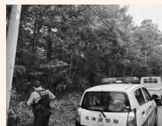
役場・警察では、不法投棄のパトロールを行っています

※投棄した人が見つからない場合、土地の所有者が投棄された物を片づけなければなりません。定期的に草刈りをするなど、不法投棄への対策をお願いします。