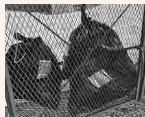
ごみステーションに置かれた違反ごみ

また、通勤途中などに他の地域のごみステーションへごみを出すことは、その地域の方々に迷惑がかかるのでやめましょう。ごみは生活カレンダーなどで分別方法や収集日を確認し、ご自分の地域の決められたごみステーションに 午前7時30分まで に出しましょう。